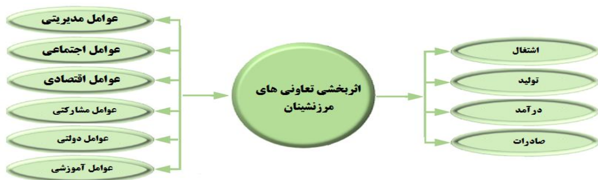
شکل ۱ - چارچوب نظری پژوهش مستخرج از مبانی نظری و پیشینه پژوهشی