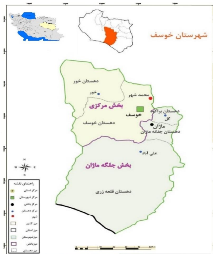
شکل ۲. نقشه تقسیمات سیاسی شهرستان خوسف (۱۳۹۵)

شهرستان خوسف در جنوب غربی استان خراسان جنوبی و در محدوده ۵۷ درجه و ۵۷ دقیقه تا ۵۹ درجه و ۲۲ دقیقه طول شرقی و ۳۱ درجه و ۲۰ دقیقه تا ۳۳ درجه و ۱۳ دقیقه عرض شمالی قرار گرفته است. ارتفاع شهر خوسف از سطح دریا ۱۳۰۰ متر می‌باشد (سالنامه آماری استان خراسان جنوبی، ۱۳۹۵: ۶۲). این شهرستان از سمت شمال به شهرستانهای سرایان و بیرجند، از جنوب شرق به شهرستان نهبندان و از جنوب به استان کرمان، از شرق به شهرستان سریشه و از جنوب غرب به شهرستان طبس محدود می‌شود (شکل ۲).