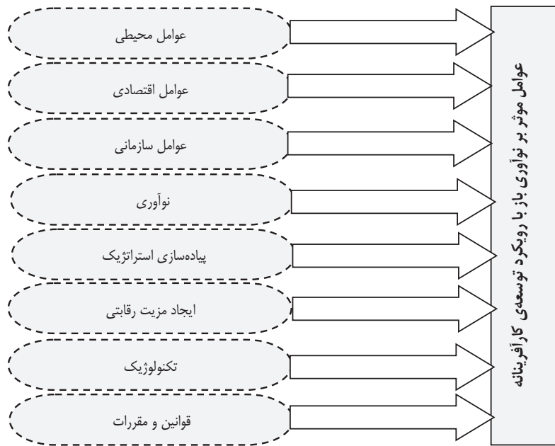
شکل ۱. عوامل موثر بر نوآوری باز با رویکرد توسعه کارآفرینانه